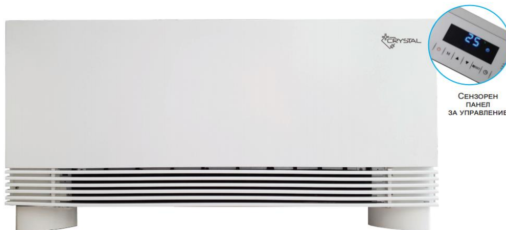
СЕНЗОРЕН ПАНЕЛ ЗА УПРАВЛЕНИЕ

(3) Охладителна мощност при температура вода 7°C/12°C и стайна температура (DB/WB) 27°C/19°C.